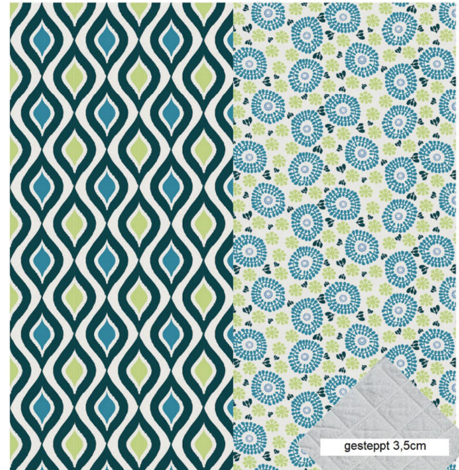
35885-004 BAUMWOLL GESTEPPT